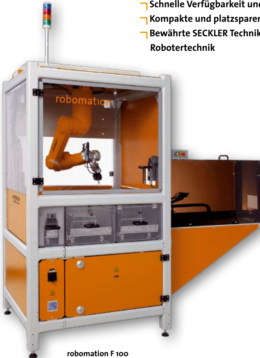
robomation F 100

robomation ist die flexible Standard-Roboterzelle zur Erhöhung Ihrer Produktivität in der Fertigung. Diese Zellen können für Werkstücke bis 1kg eingesetzt werden. Die robomation gibt es in zwei Ausführungen: